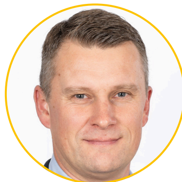
Markus Moldaschl Vizebürgermeister GPO-Stellvertreter