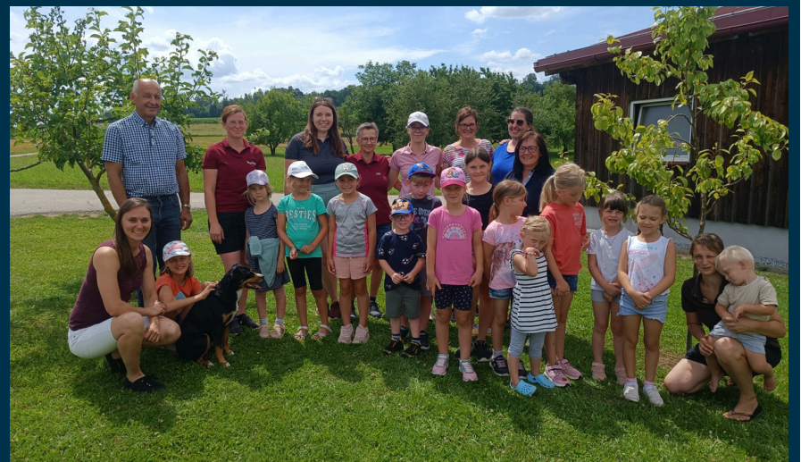
Kleinzwettler Pferdehof- Pferdestark: kreativ am Pferdehof