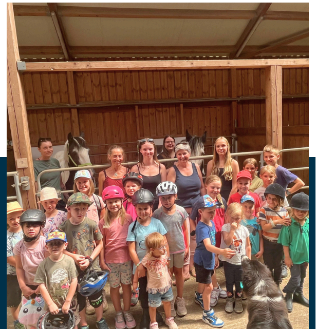
Die Bäuerinnen - Tolle Knolle USV ProPet Gastern - Spaß mit Bewegung und Ball Pferdehof Kanzian- Alles rund um's Pferd