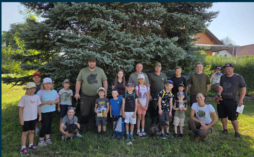
Die Jäger des Reviers Garolden