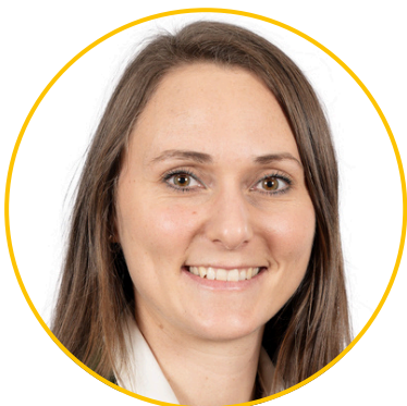
Viktoria Hutter Geimeindeparteiobfrau Bundesrätin